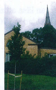
Sällskapets vårdträd utanför Örgryte församlingshem.